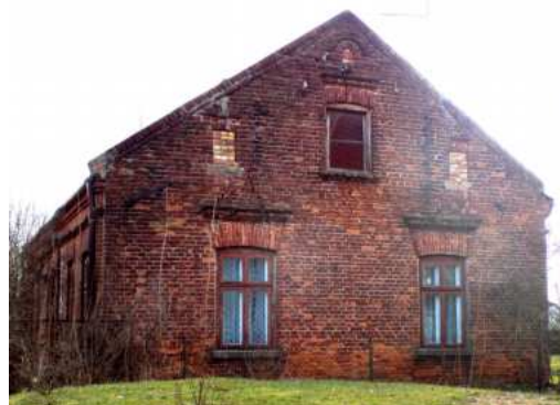
Budynek pierwszej szkoły w GałkóWKu-Kolonii